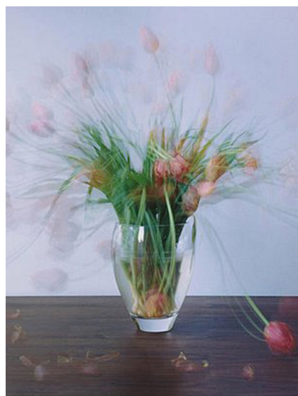
Michel Wesely – Still life.

D al 5 febbraio al 27 marzo 2008 è aperta a Roma presso lo Studio D'Arte Contemporanea Pino Casagrande (Roma, via degli Ausoni, 7/a) una interessantissima mostra fotografica dell'artista Michael Wesely.