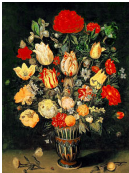
Ambrosius Bosschaert il Vecchio (1537-1623), Natura morta

Così, nei vasi di fiori della esposizione romana non si coglie l'ora del bocciolo né quella del fiore appassito, ma l'intero evolversi la realtà che trascorre in un determinato luogo tra un istante iniziale ed uno finale. Istanti impressi a caratteri di stampa nelle stesse immagini, a testimoniare l'angolo di tempo che esse pazientemente sottendono: da una settimana a dieci giorni. Un intervallo adatto a rappresentare la caducità della bellezza e l'omnipresenza della morte in fieri anche nel più fulgido splendore dei colori della vita. Alla vanitas, dunque alludono queste opere, come quelle che appartennero alla tradizione della pittura dei Paesi Bassi nel XVII secolo, popolate assieme ai fiori, destinati ad appassire, da libri consunti a forza di esser letti (simbolo della vacuità di ogni scienza), frutta marcia o altri cibi imputriditi, insetti e topi (in quanto accelerano la decomposizione), ma anche oggetti pregiati ed insegne del potere che rammentavano la caducità di ricchezza e signoria, o carte da gioco e dadi, emblema invece del tempo mal utilizzato.