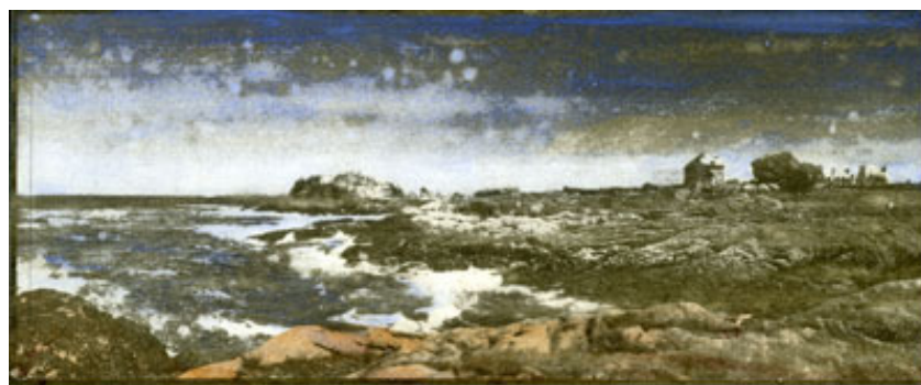
Territori atlantici del Finis Terrae francese. Gomma bicromata (2005). A. Iazeolla

Secondo Argan, l'artista medievale era responsabile solo dell'esecuzione, perché i contenuti e perfino i temi di immagine gli erano in qualche modo dati.