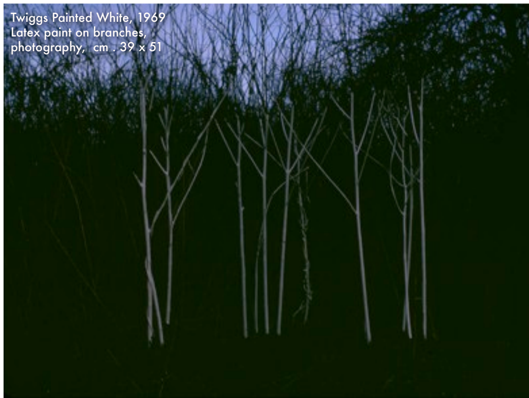
Twiggs Painted White, 1969 Latex paint on branches, photography, cm . 39 x 51

di fuori dei canoni della stessa arte concettuale, nella quale non desidera rimanere confinato. La ripetizione dei medesimi soggetti diviene testimonianza della ricerca di una sintesi geometrica assoluta, di una catarsi dall'ornamento, di una smaterializzazione degli oggetti, alla stregua dell'operazione di cui fu artefice Giorgio Morandi e che Beckley dichiara di assumere a modello. Con risultati che talvolta, per effetto della coincidenza degli