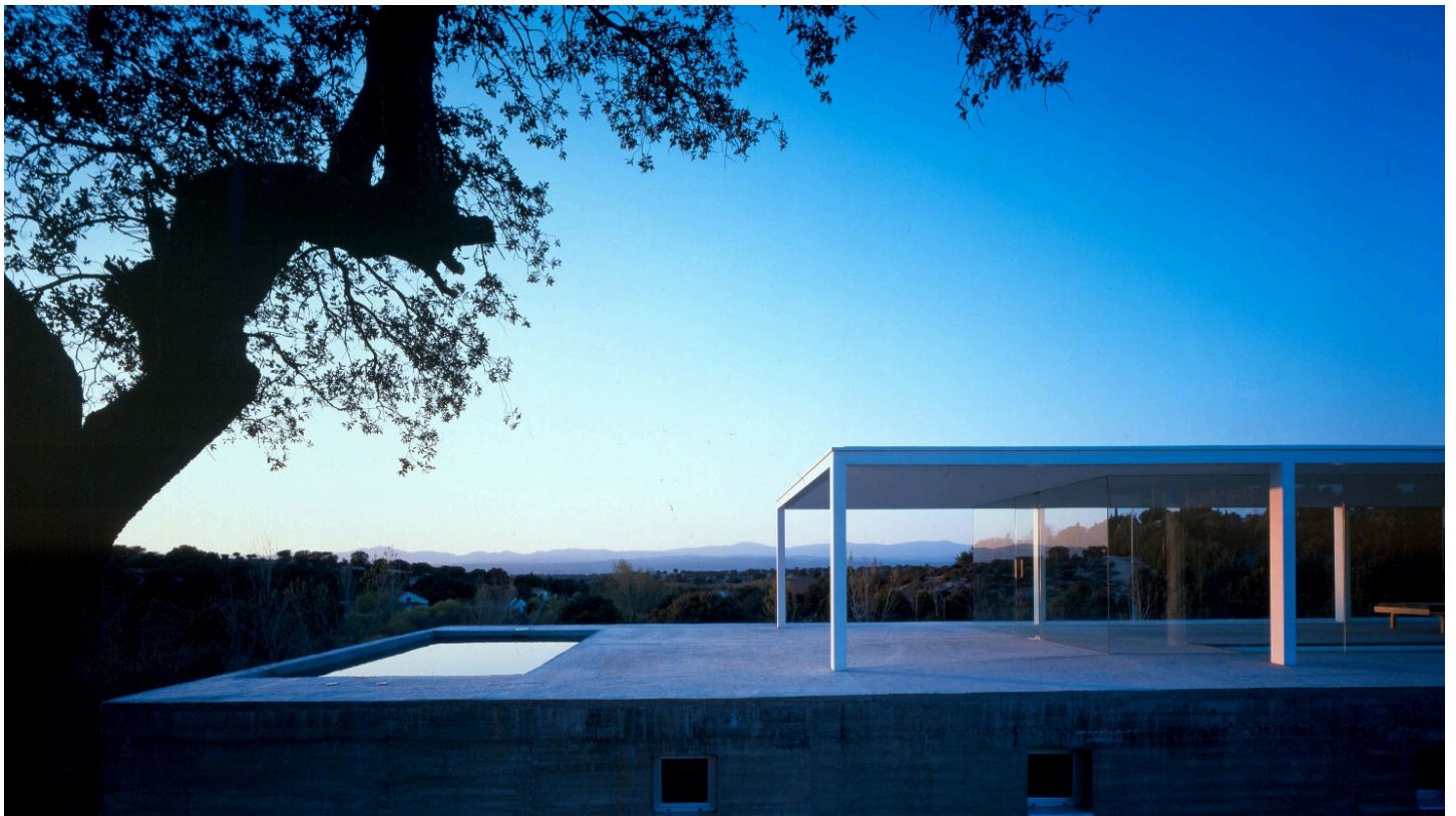
Alberto Campo Baeza - Casa De Blas - Madrid, 2000

Nella Galleria 2 l'atmosfera è rarefatta, lo spazio dilatato tra i pochi elementi che lo delineano. Sullo sfondo, una smisurata fotografia luminosa dominata dal rettangolo bianco di un muro, al soffitto un disco metallico a cui sono appesi centinaia di piccoli disegni, a terra uno grande monitor con immagini mutevoli, e infine una struttura che racchiude 12 plastici e un percorso cronologico.