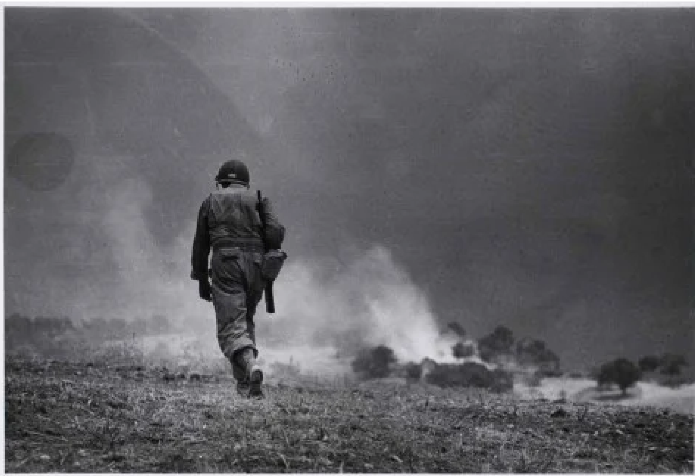
Robert Capa, Soldato americano in perlustrazione nei dintorni di Troina, 4-5 agosto 1943 – Robert Capa © International Center of Photography/Magnum – Collezione del Museo Nazionale Ungherese

A Roma sono raccolte 78 fotografie: Monreale, Palermo, Napoli, campagne e paesi del sud, accompagnate dai testi di un libro in cui Capa testimonia come in un diario l'esperienza della propria professione in prima linea. Il titolo, Slightly out of focus , fa ironico riferimento al commento apparso su Life alle sue celebri immagini dello sbarco in Normandia, scritto da chi certo non comprese come tutta la sua vita fosse, al contrario, un progressivo mettere a fuoco la guerra. Da dentro. Fino a subirne la stretta mortale.