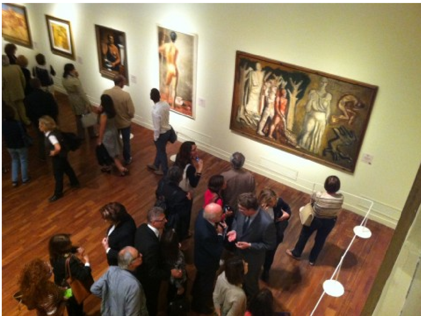
Cézanne e gli artisti italiani del '900 – veduta della mostra presso il Complesso del Vittoriano, Roma 2013

I più ampi spazi della mostra sono però dedicati a Giorgio Morandi , che – al contrario di Boccioni – ispira sin dall’inizio a Cézanne la sua opera, dai nudi ai paesaggi, e a Carlo Carrà , che condivide con il maestro di Aix la certezza che uno sguardo intenso sulla natura possa corrispondere a un’introspezione della condizione umana. Ad affiancarli, si allineano suggestioni e rimandi all’artista francese nelle opere, tra gli altri, di Gino Severini , Mario Sironi , Felice Casorati , Felice Carena , Francesco Trombadori , Giuseppe Capogrossi , Franco Gentilini , Fausto Pirandello . Testimonianze non certamente esaustive della presenza di Cézanne nell’arte italiana, ma in grado di dimostrare pienamente il suo essenziale ruolo di rivoluzione e rinnovamento.